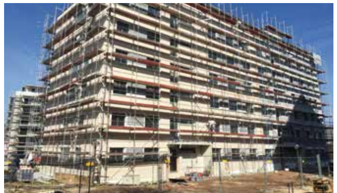
„Wohnen am Wasser“