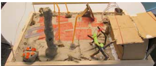
Spielplatzplanung in Brühl

Im November 2016 haben Brühler Kinder „ihre“ Spielfläche für den Neubau „Wohnen am Wasser“ und das Gemeinwesenzentrum geplant. Die Erwachsenen Brühlerinnen und Brühler trafen sich am nächsten Tag und sammelten Ideen für das neue Gemeinwesenzentrum und den Quartiersplatz.