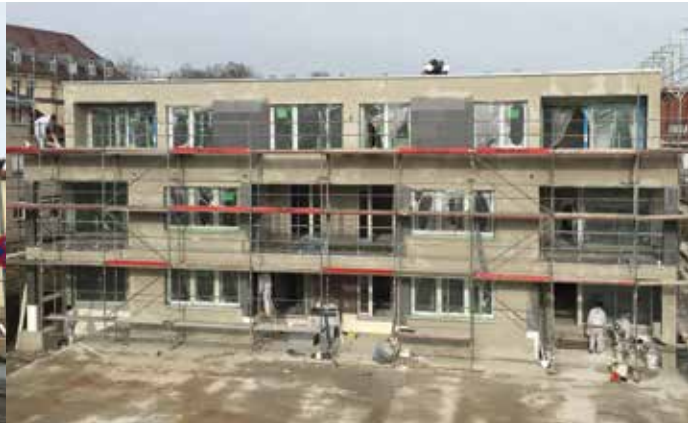
Kurze Straße 4 | 10 Wohneinheiten

Das Gebäude in der Kurze Straße bietet Wohnraum für zehn Familien und teilt sich auf in drei Vier-Zimmer-Wohnungen, drei Drei-Zimmer-Wohnungen und vier Zwei-Zimmer-Wohnungen. Hier sind alle Wohnungen barrierefrei erreichbar, weil das Gebäude einen Aufzug hat.