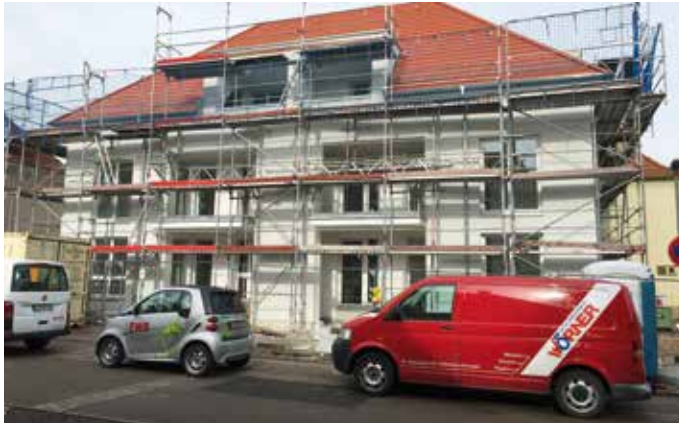
Kantinestraße 3 | 6 Wohneinheiten

Wohnen in einem ruhigen Quartier – alle Geschäfte für den täglichen Bedarf direkt nebenan: Das zeichnet die beiden Neubauten in der Kantinestraße 3 und der Kurze Straße 4 aus, die derzeit von der EWB gebaut werden.